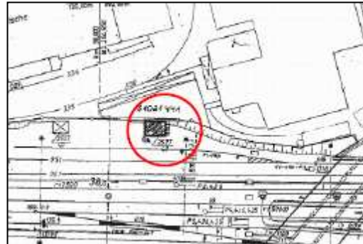
Lage des Abbruchobjekts