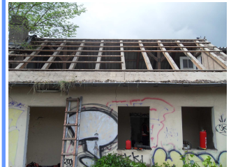
Abbruch- und Ladearbeiten