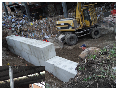
Aufstellen von K-Blöcken